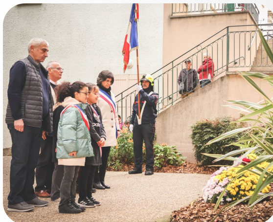
11 NOVEMBRE 2024 COMMÉMORATION DE L'ARMISTICE DU 11 NOVEMBRE 1918 MONUMENT AUX MORTS