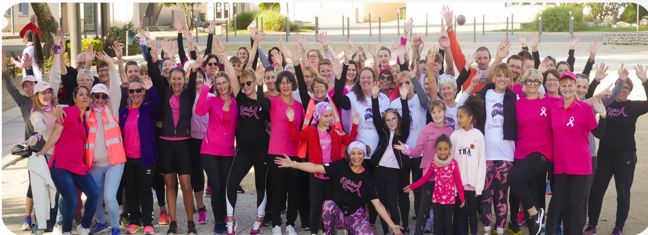
13 OCTOBRE 2024 OCTOBRE ROSE FITNESS GÉANT PLACE DU CHAMP DE MARS