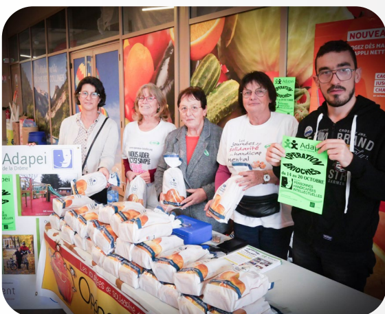
16 OCTOBRE 2024 VISITES «OPÉRATION BRIOCHES» INTERMARCHÉ ET NETTO