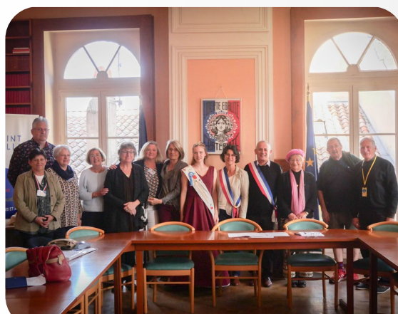
25 OCTOBRE 2024 RÉCEPTION DES VILLES JUMELLES WITZENHAUSEN ET FILTON EN MAIRIE