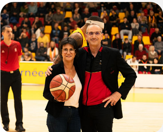
9 NOVEMBRE 2024 LA VILLE PARTENAIRE DU MATCH SVBD - BESANÇON COMPLEXE DES 2 RIVES