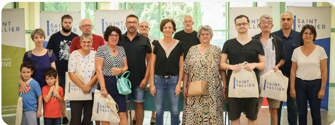
7 SEPTEMBRE 2024 MATINÉE D'ACCUEIL DES NOUVEAUX HABITANTS EN MAIRIE