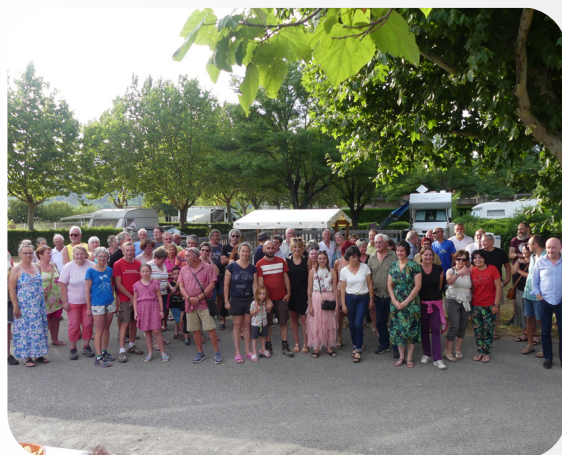
9 JUILLET 2024 APÉRITIF DES CAMPEURS EN PARTENARIAT AVEC L'UCIA CAMPING MUNICIPAL