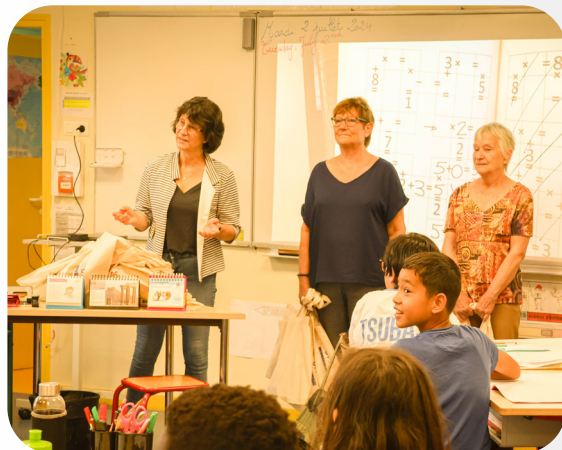
2 JUILLET 2024 REMISE DES DICTIONNAIRES AUX CM2 DANS LES ÉCOLES DE LA COMMUNE