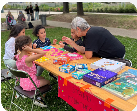
7 JUILLET 2024 SOIRÉE INTERGÉNÉRATIONNELLE QUARTIER LIORA