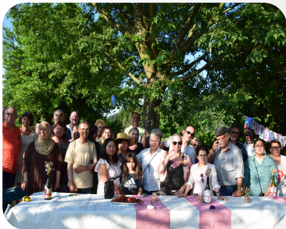
27 JUN 2024 BARBECUE DES JARDINS PARTAGÉS JARDINS PARTAGÉS